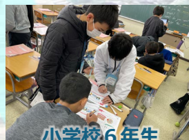
小学校6年生 中学校授業体験