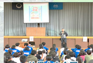
幼保小中合同 防災訓練