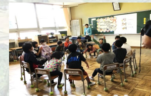
NAiSUタイム 人間関係プログラム