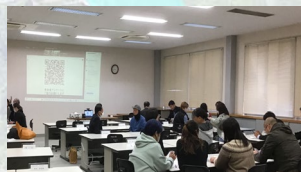
地域学校保健委員会