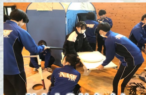
NAiSUタイム -防災学習プログラム